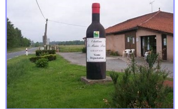
Château Le Maine Périn

Terrine de Mamé et pizza Pavé de bœuf Bazadais et gratin dauphinois Tomme de Bazas et salade Dessert de Captieux Vin compris