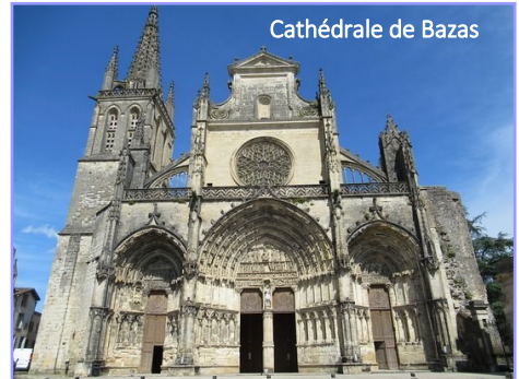
Cathédrale de Bazas

Après midi : défilé des bœufs gras et concours, visite de la cathédrale et sous la halle marché de producteurs. 17h00 : retour au Maine Périn.