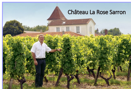
Château La Rose Sarron