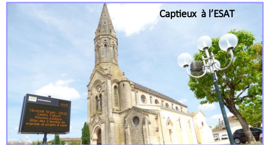
Captieux à l'ESAT

Après midi : défilé des bœufs gras avec Lous Dé Bazats (groupe folklorique).