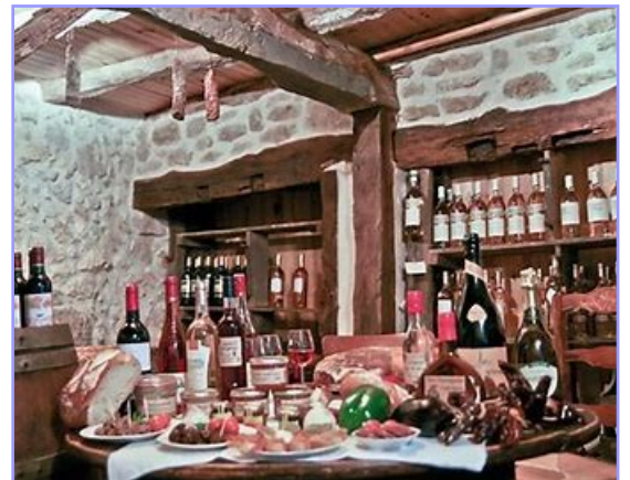
La ferme de Lafitte à Montgaillard

Apéritif et saucisson Garbure au jarret Salade du terroir Jambon braisé et ses légumes Salade et fromage du pays Croustade aux pommes et à l'armagnac Café, vin rouge et rosé