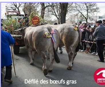
Défilé des bœufs gras

Après midi : défilé des bœufs gras avec Lous Dé Bazats (groupe folklorique).