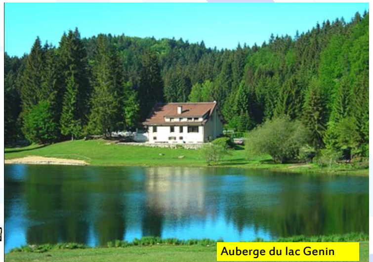
Auberge du lac Genin